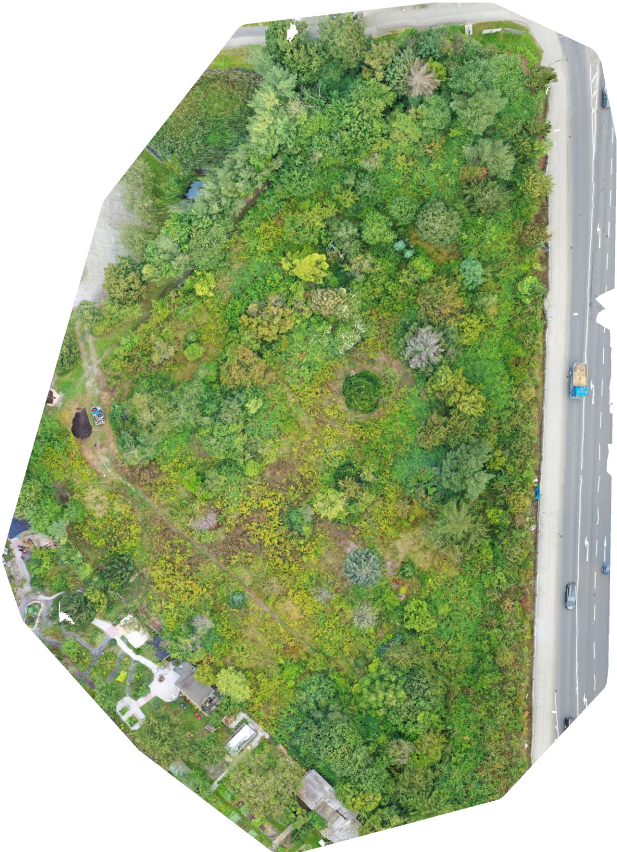
Bild 1: Ausgangszustand der Maßnahmenfläche, Drohnfoto (Stand 2021)