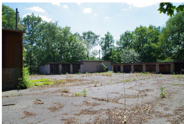
Ausgangszustand: ehemaliger Betriebshof mit Gebäuden und Asphaltbefestigung

Die Maßnahmegelände liegt an der Staatsstraße S 173 in Dohma und wurde von der Straßenmeisterei als Betriebshof genutzt. Auf der Fläche befanden sich mehrere Garagen und Lagergebäude. Sonstige Flächen waren mit Asphalt befestigt.