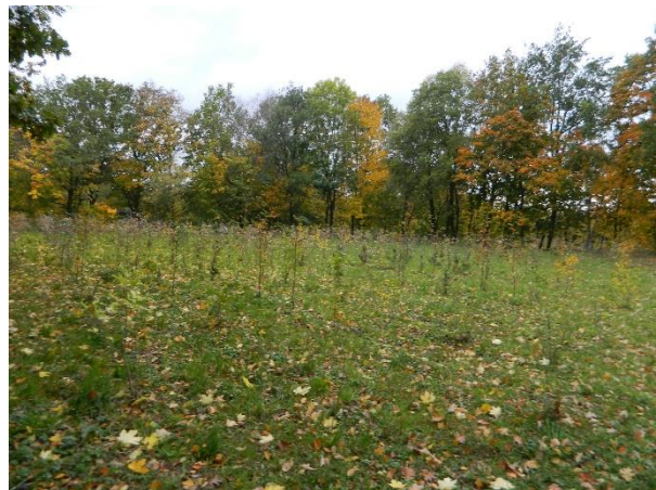
Bepflanzung bei der Abnahme Fertigstellungspflege im Herbst 2020

Nach der Geländeherstellung erfolgte im Frühjahr 2020 die Anlage eines Feldgehölzes aus einheimischen, standortgerechten, gebietseigenen Gehölzen. Die Auswahl der Gehölze richtete sich dabei nach der potentiellen natürlichen Vegetation in diesem Bereich. Durch Pflanzung heimischer Baum- und Straucharten wird die Fläche zu einem naturnahen Feldgehölz entwickelt, das in die angrenzenden Gehölzbestände überleitet.