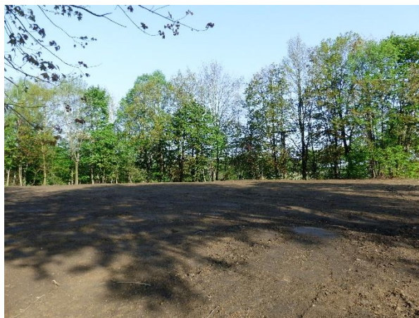
Fläche nach dem Gebäuderückbau und der Entsiegelung mit Oberbodenanddeckung

Die vorhandenen Gebäude sowie sonstige versiegelte Flächen wurden im Frühjahr 2019 abgerissen und vollständig zurückgebaut. Das Abbruchmaterial wurde fachgerecht entsorgt. Die durch den Abbruch entstandenen Baugruben wurden geländegleich mit natürlichem, standortgerechtem Boden aufgefüllt und abschließend mit Oberboden angedeckt.