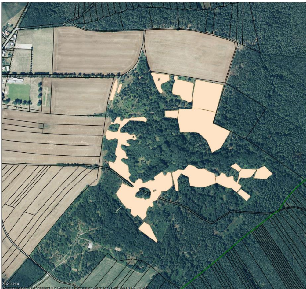
Geodaten © Staatsbetrieb Geobasisdaten und Vermessung Sachsen (GeoSN), 2024